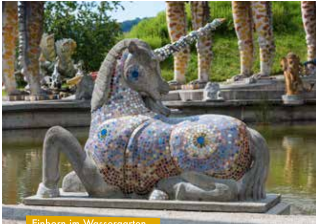
Einhorn im Wassergarten

Mit seinem imposanten Gesamtkunstwerk gelingt es Bruno Weber, die Kreativität im Einklang mit der Natur zu einer erlebbaren Fantasie werden zu lassen.