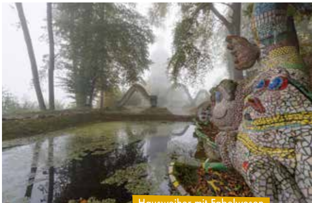
Hausweiher mit Fabelwesen