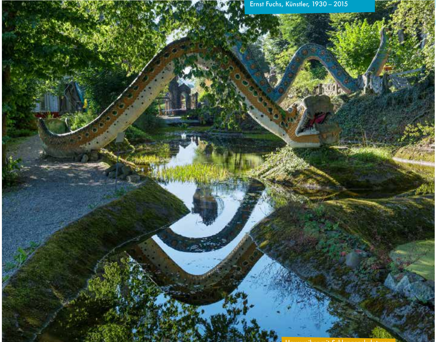
Hausweiher mit Schlangenskulpturen